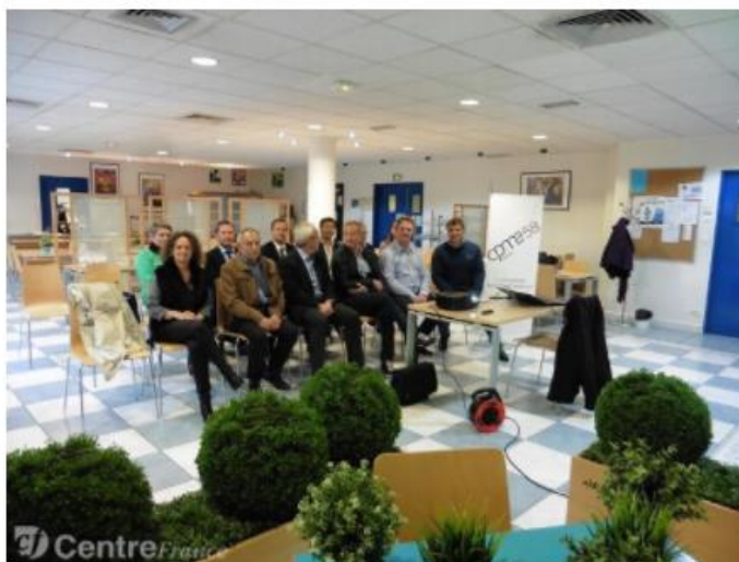
À la Polyclinique du Val de Loire, une réunion sur le thème, la santé et la sécurité dans les entreprises. ©